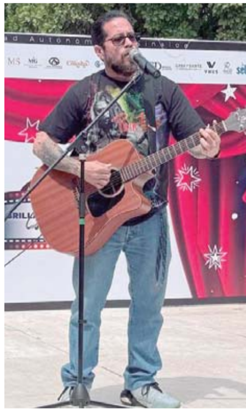
Toda persona vinculada con la UAS puede participar.