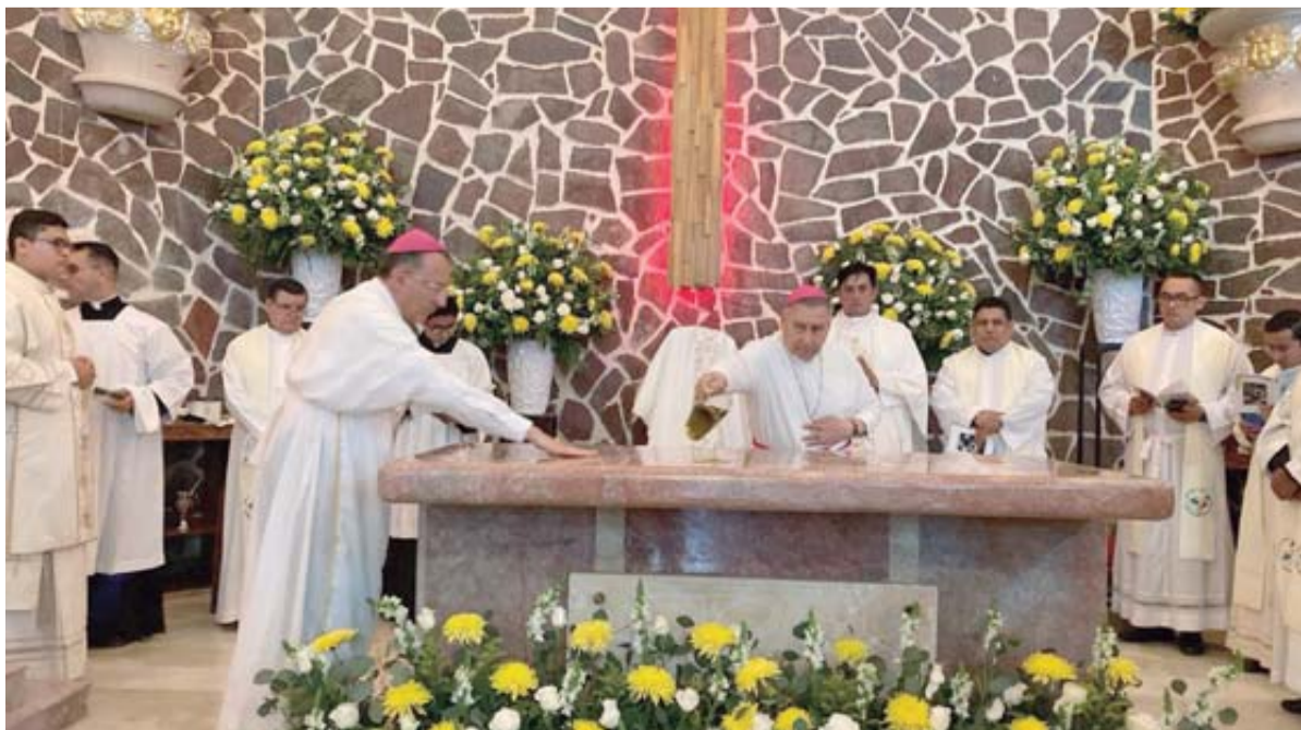
El Nuncio Apostólico, Joseph Spiteri, y el Obispo de Mazatlán, ungen el altar.

“Yo les decía que va a ser un abril de mucha bonanza para los mazatlanos porque también tenemos seis cruceros en esa temporada vacacional. Esto representan 20 mil cruceristas que van a estar aquí en Mazatlán y también vamos a tener eventos deportivos como lo son partidos del Mazatlán FC”, añadió la Alcaldesa.