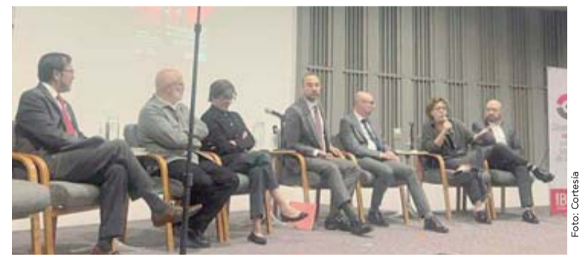
Presentación del Observatorio Ibero sobre el Sistema de Justicia.