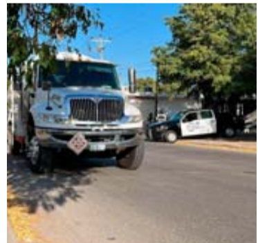
La Guardia Nacional aseguró el lugar.

Los civiles procedieron a llevarse al hombre hacia un rumbo desconocido y también se subieron a la pipa para movilarla del sitio y robársela, sin embargo la dejaron abandonada a unas ocho calles de distancia de donde sometieron al hombre, entre la calle Miguel Hidalgo y el bulevar Agricultores.