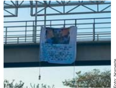
La manta apareció en la colonia Colinas de San Miguel.