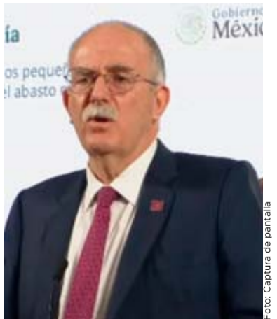
El Secretario de Agricultura Julio Berdegué Sacristán

Además, informó que alistaban la creación de una nueva institución para la mejora de semillas. También aseguró que la Presidenta Sheinbaum Pardo firmaría un decreto para crear la