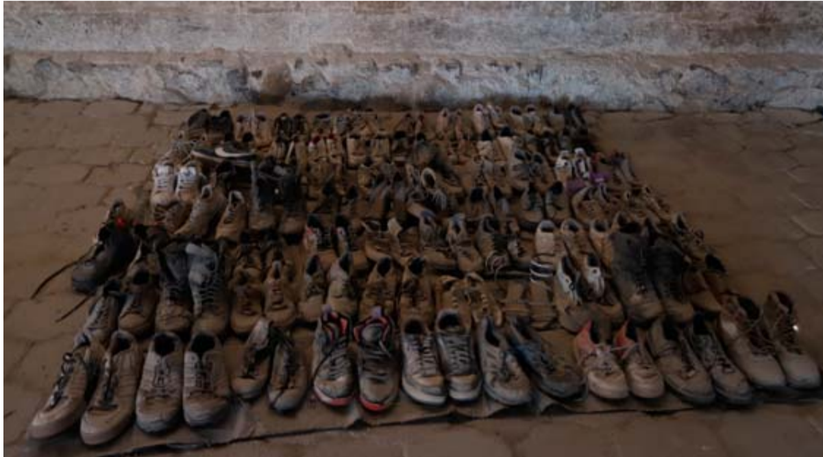
El Comité contra la Desaparición Forzada de la ONU dictó medidas cautelares por los hallazgos en el Rancho Izaguirre en Teuchitlán, Jalisco.

Si se declaran que las desapariciones en México son sistemáticas y generalizadas se puede demandar al Estado mexicano ante la Corte Penal Internacional