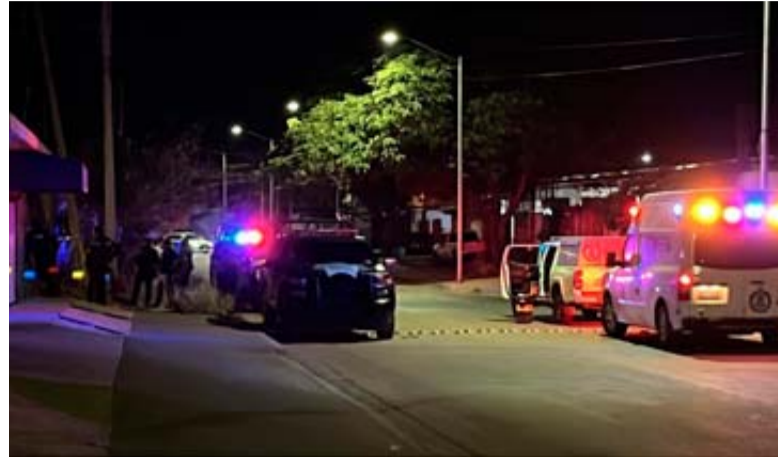
El cuerpo de un hombre fue localizado este viernes en calles del sector El Barrio.

El cadáver será transportado hacia las instalaciones del Servicio Médico Forense para aplicar la autopsia de ley.