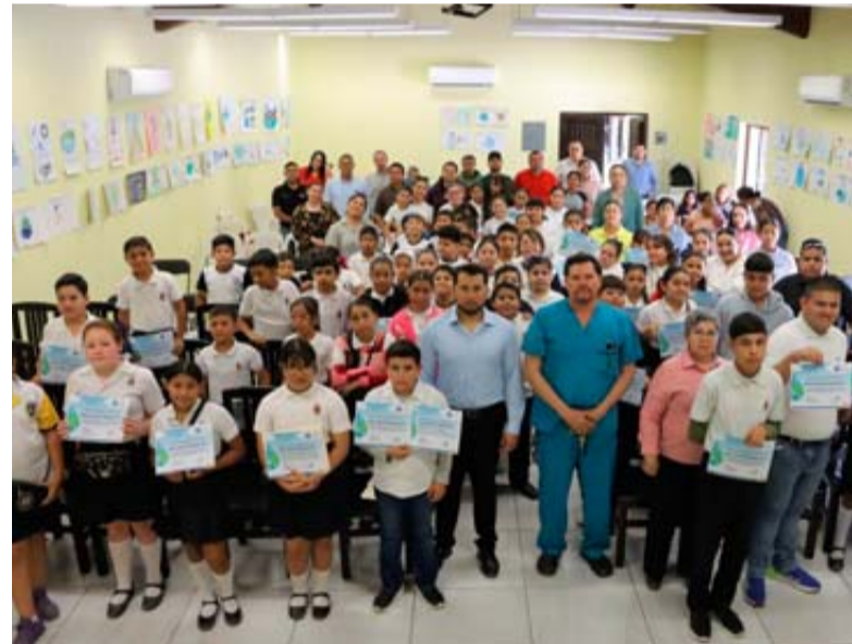
Los tres primeros lugares recibieron un premio en efectivo de 4 mil, 3 mil y 2 mil pesos.

Cabe recordar que el certamen fue lanzado el 7 de marzo y participaron niños de cuarto, quinto y sexto grado de primaria, con la elaboración de un dibujo que resaltara la importancia del cuidado del agua y los ganadores se eligieron a través de redes sociales, con la mayor cantidad de reacciones o “likes”.