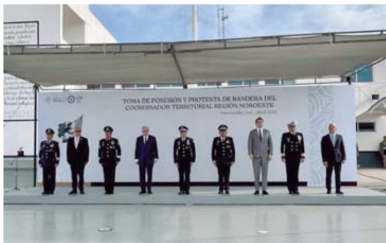
Ocho Coordinaciones Territoriales fueron creadas por Defensa.

La primera de estas Coordinaciones Territoriales es la Región Noroeste, que comprenden las coordinaciones estatales de Baja California, Baja California Sur, Sonora, Sinaloa y Chihuahua, cuya sede estará en el municipio sonorense de Hermosillo y cuyo encargado será el General de Brigada del E. M., Crisóforo Martínez Parra, ex subjefe operativo del Estado Mayor Conjunto de Defensa, quien el 2 de abril