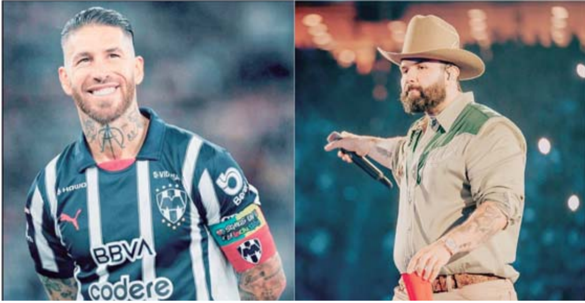
Sergio Ramos y Carín León.

Fue a través de una entrevista con el podcast Acá Entre Nozz, donde el intérprete reveló la colaboración que está realizando junto al futbolista español