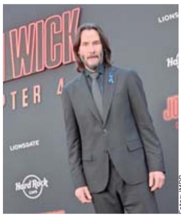
John Wick continúa su saga.

Los animatrónicos Toy y Withered cobran vida en la oscuridad, acechando al protagonista y desafiando su habilidad para monitorear cámaras y mantener las amenazas bajo control.