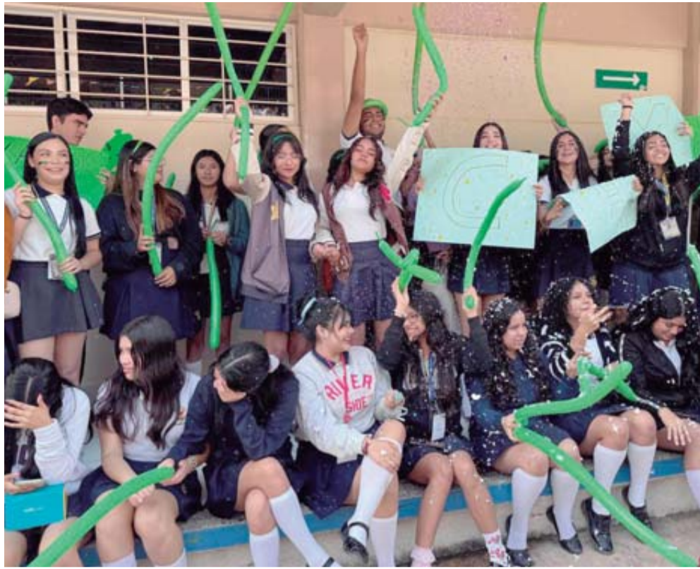
Las porras de los universitarios no se hacen esperar en cada uno de las etapas.