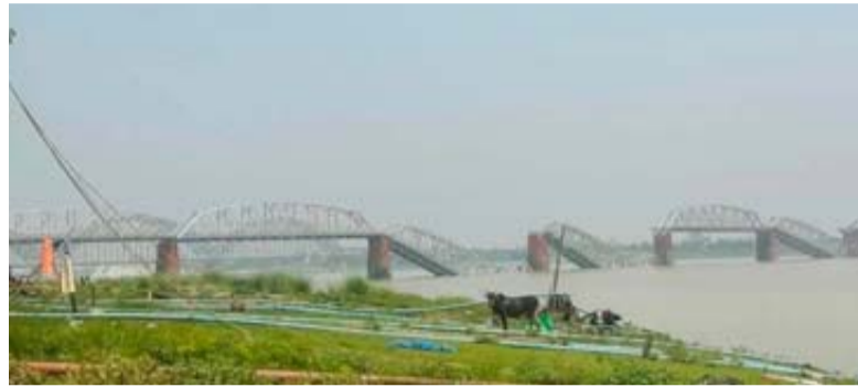
Las evaluaciones han puesto de manifiesto la destrucción generalizada en toda la zona central de Myanmar.

"Se trata de un operativo militar individual que utiliza un ala delta con una mochila atada a la espalda o al torso con un gran ventilador y lo utiliza para volar en parapente utilizando el ventilador como motor sobre las zonas y lanzar bombas o municiones portátiles sobre los objetivos que se encuentran debajo".