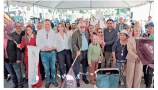
El Gobernador Rubén Rocha Moya, funcionarios e invitados, dan el banderazo de inicio.