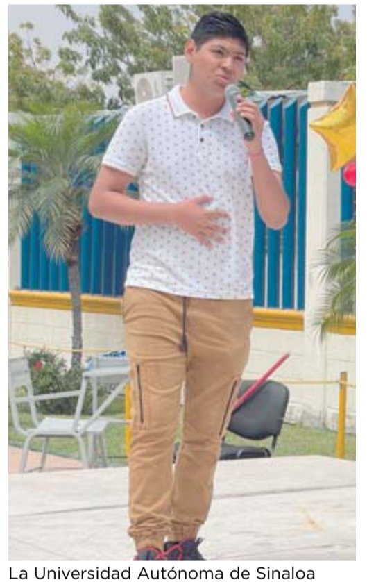
La Universidad Autónoma de Sinaloa Región Sur lleva a cabo el concurso Brillando con la UAS Visión 2025.