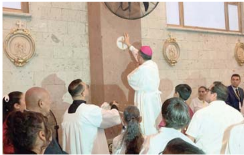
El Nuncio Apostólico unge los muros del templo como parte del rito de consagración.

Se trata de un mecanismo que se cumple al llegar a la edad de su jubilación y se mantendrá en el cargo hasta que el Papa nombre a un sustituto