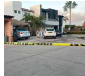
La vivienda es de una privada del sector Tres Ríos.

Los bomberos se encargaron de sofocar el siniestro mientras ayudaban a rescatar a la familia del inmueble, por su parte los agentes policiales se encargaron de asegurar la zona y de marcar el perímetro de la escena con la cinta amarilla de precaución.