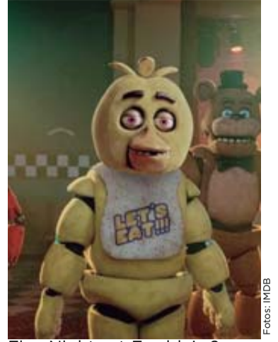
Five Nights at Freddy's 2.

Por ahora toca esperar a que el proyecto avance y estar atentos a la nueva información que pueda surgir de la canción.