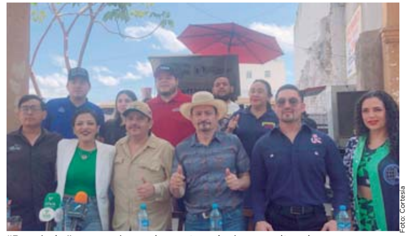
“Propinón” es una jornada gastronómica y cultural con causa, cuyo objetivo es apoyar a meseros y cocineros que se han visto afectados por la violencia en Sinaloa.

sociedad y la sociedad, ya he dicho yo, tiene que regresar esa confianza también porque si no nos entendemos la autoridad y la sociedad, sobretodo su parte organizada se nos va a complicar el problema de la seguridad”, apuntó el presidente de la Comisión Estatal de Derechos Humanos.