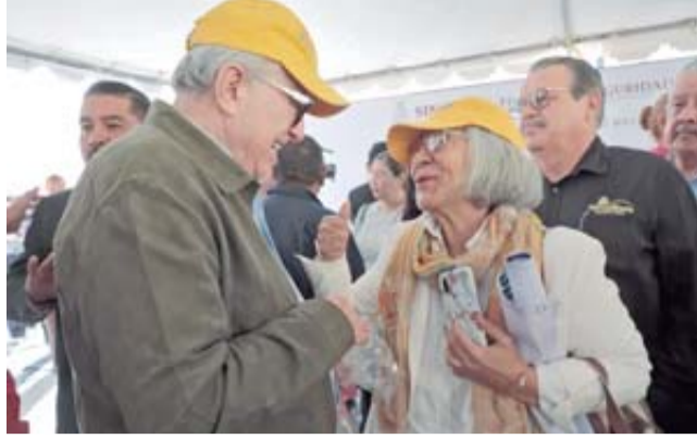
El Mandatario estatal destaca que el turismo es fundamental para la economía sinaloense.