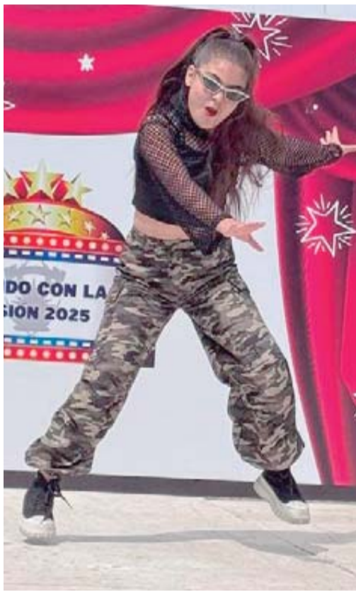
El baile es una de las categorías en las que más participan.

informó que la UAS refuerza su compromiso con el impulso a la cultura y las artes, promoviendo la participación y el desarrollo artístico de su comunidad.