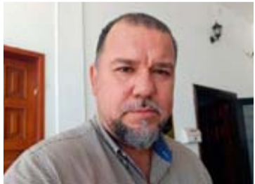
El dirigente del Sindicato del Ayuntamiento señaló que no ha habido diálogo con el Alcalde de Escuinapa.

“Estamos en eso de meter las demandas, de manera individual, por diversos rubros, los jubilados por el tema de canastas básicas que le tocan, el bono de cuatro días de salario que les toca en noviembre y los activos