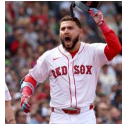
Los Medias Rojas mejoraron a 73-52 en juegos inaugurales en casa.

Los Bravos ganaron su primer partido en casa para poner fin a una racha de siete juegos sin ganar, su peor inicio desde que perdieron sus primeros nueve en 2016. Atlanta se convirtió en el último equipo de las mayores en ganar su primer juego. Ningún equipo