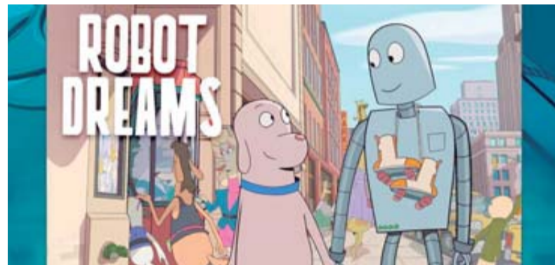
‘Mi amigo robot’, se proyectará este sábado en el Cinematógrafo ‘Marco Lugo’.

“Mi amigo robot” es una entrañable y emotiva película de animación basada en la novela gráfica ‘Robot Dreams’ de la ilustradora estadounidense Sara Varon, la cual obtuvo varios premios en festivales como Premios Goya, Premios Annie, Premios Alma, Festival