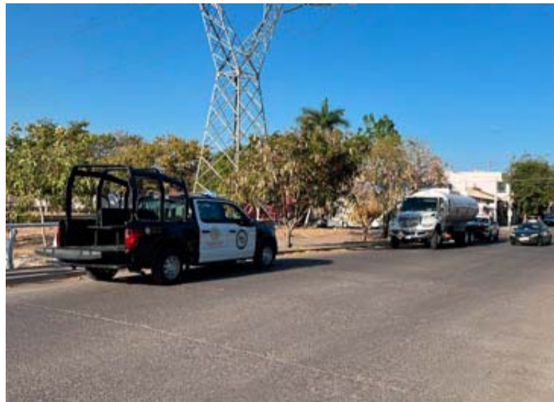
En Culiacán, un hombre fue privado de la libertad y dejan una pipa abandonada.

En tanto, elementos de la Guardia Nacional, de la Secretaría de Seguridad y