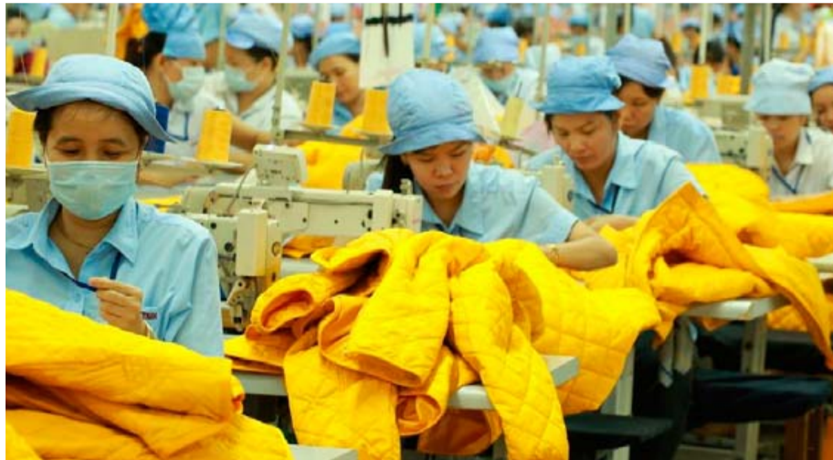
Trabajadoras de una fábrica textil de Vietnam cosen chaquetas destinadas a mercados occidentales.

"Hacerlo con una fórmula que mide el déficit comercial y el ratio del déficit comercial sobre las importaciones, personalmente nunca había visto algo así", subrayó