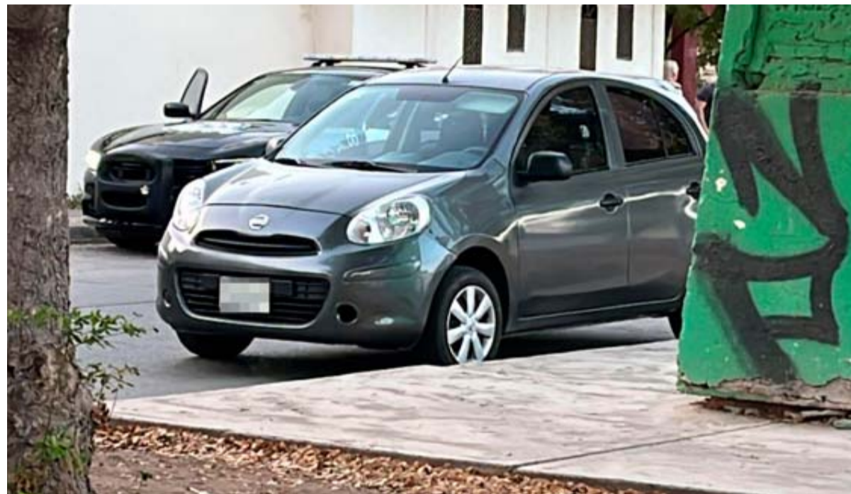
El vehículo balazos fue localizado entre el bulevar Constelaciones y la calle Primera, en Culiacán.

Vecinos notificaron lo sucedido a las autoridades, que se movilizaron hacia el sector hasta que encontraron el auto baleado entre el bulevar Constelaciones y la calle Primera, cerca de una conocida plaza comercial.