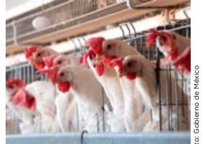
La Secretaría de Salud informó del primer caso humano con influenza aviar A .

Sandoval enfatizó la importancia de que en los casos llevados ante el CED se considere la participación de los colectivos en un sentido extenso, no solo en función del proceso dentro del ámbito de lo penal, sino que exista un proceso de participación sustantiva en el contexto más amplio, incluido el componente de la protección.