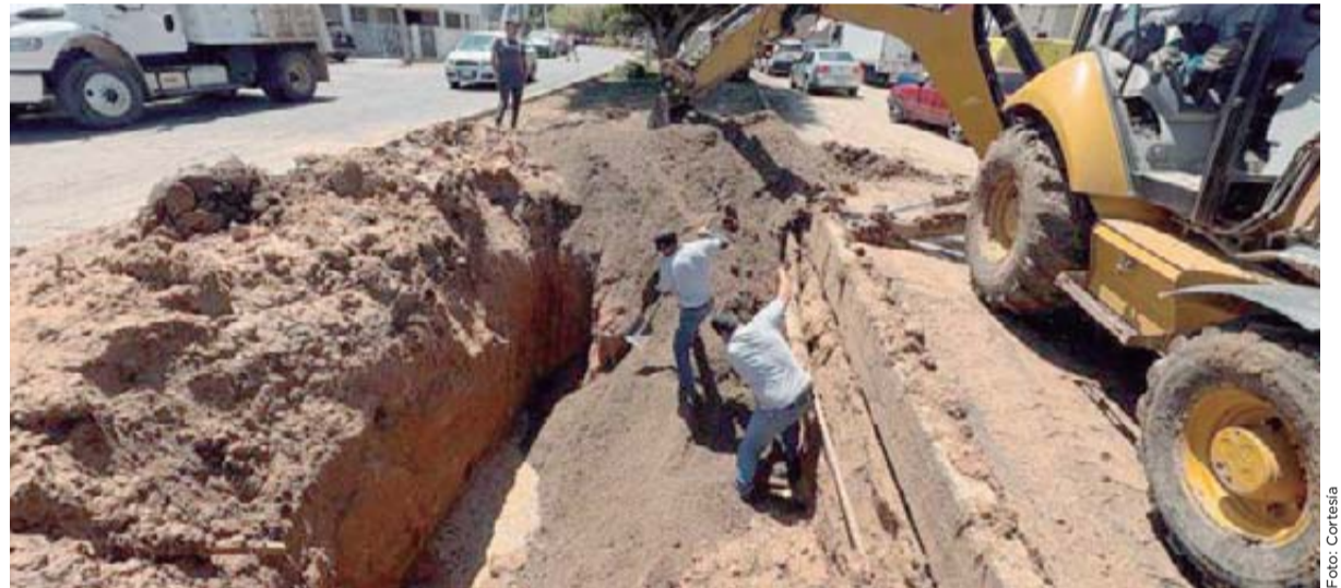
Jumapam informó que reparó el daño registrado sobre la avenida Revolución.

"Es muy importante que cuando vean el mar y vean un cambio de color tomen en cuenta varios factores, ver que época es, invierno o primavera, pueden tomar una botella, tomar muestra y llevarla a la unidad académica en Mazatlán y ahí habrá alguien que en ese momento va a sacar un microscopio, obtendrá una muestra y la podrá ver y determinar si es benéfico, inocuo o dañino".