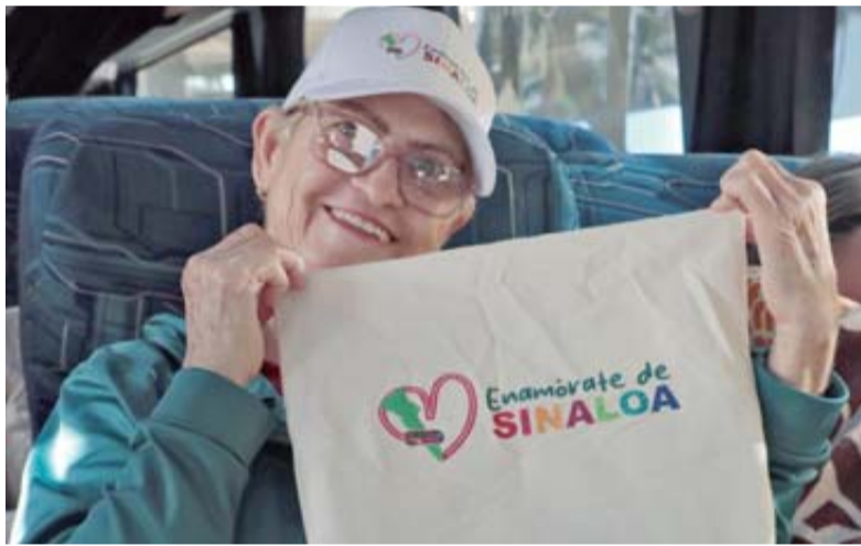
Los primeros turistas ya hicieron parte del programa "Enamórate de Sinaloa", que busca incentivar el turismo local y promover la riqueza cultural, natural y gastronómica de la entidad.

El Gobernador Rubén Rocha Moya dio el banderazo de inicio, enfocado en recorrer destinos y comunidades del estado para que a través de su cultura, gastronomía y tradiciones se desarrolle su vocación turística