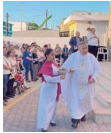
El Obispo de Mazatlán, en la aspersión del agua.

Durante la misa se celebró el rito de consagración, que incluyó la unción del altar, la incen-