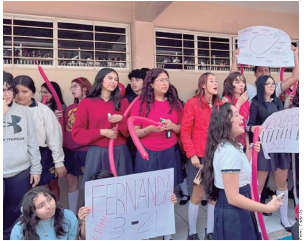
Los alumnos de las diferentes Unidades Académicas apoyan a sus representantes.