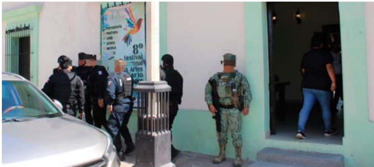
La Alcaldesa de Rosario evitó hablar de los participantes del encuentro.

Descarta Alcaldesa de Rosario que el encuentro correspondiera a la llamada Mesa de Seguridad